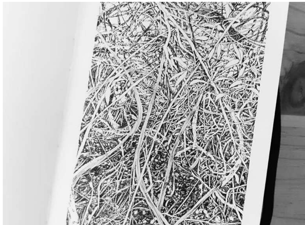
"URWALD VON MORGEN #10" - 13X21 CM - ENCRE DE CHINE SUR PAPIER MOLESKINE - MONTENACH - FRANCE, 2019