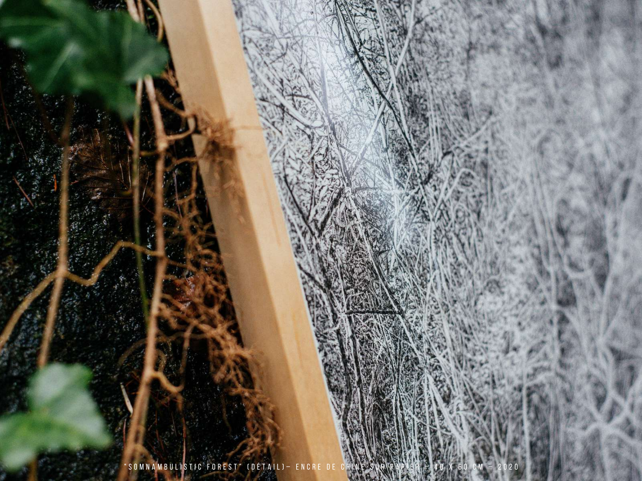
"SOMNAMBULISTIC FOREST" (DÉTAIL) - ENCRE DE CHINE SUR PAPIER - 40 X 60 CM - 2020