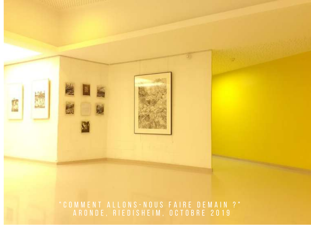
"COMMENT ALLONS-NOUS FAIRE DEMAIN ?" ARONDE, RIEDISHEIM, OCTOBRE 2019