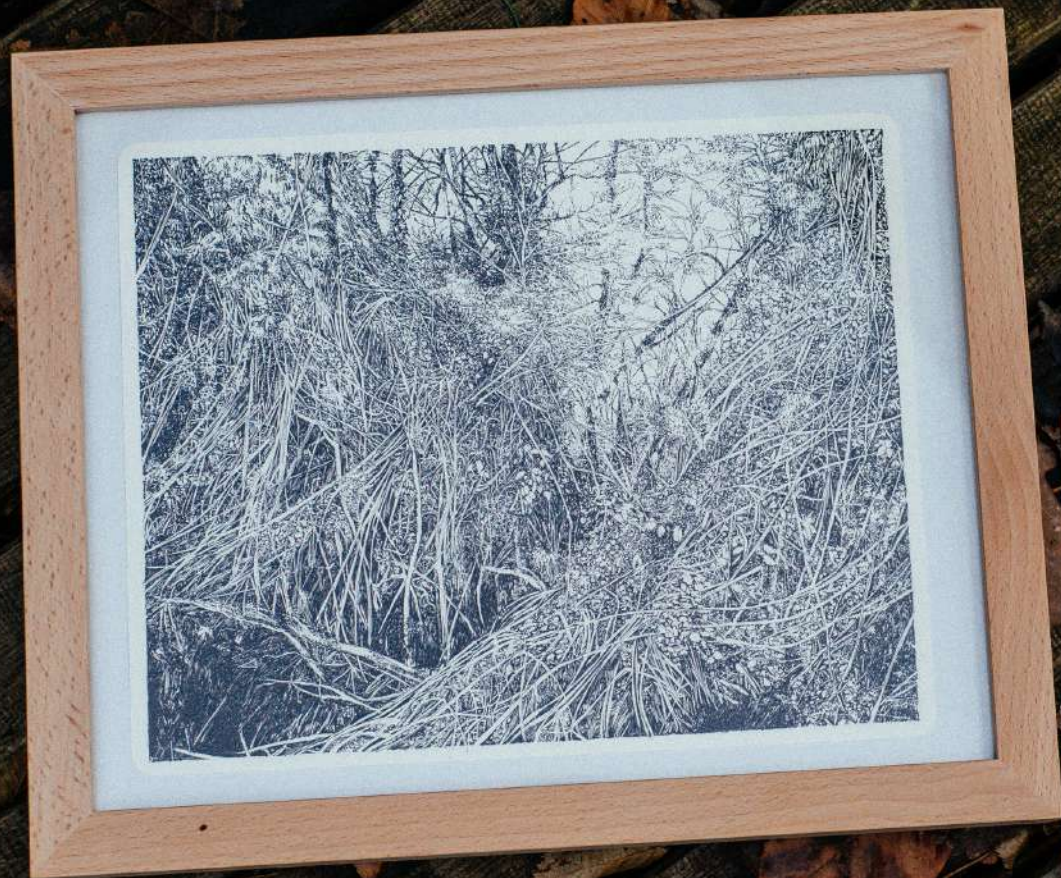
"EÜROPA ARBARO - EUROPEAN FOREST" - ENCRE DE CHINE SUR PAPIER MOLESKINE - 25,5 X 20,7 CM, 2020