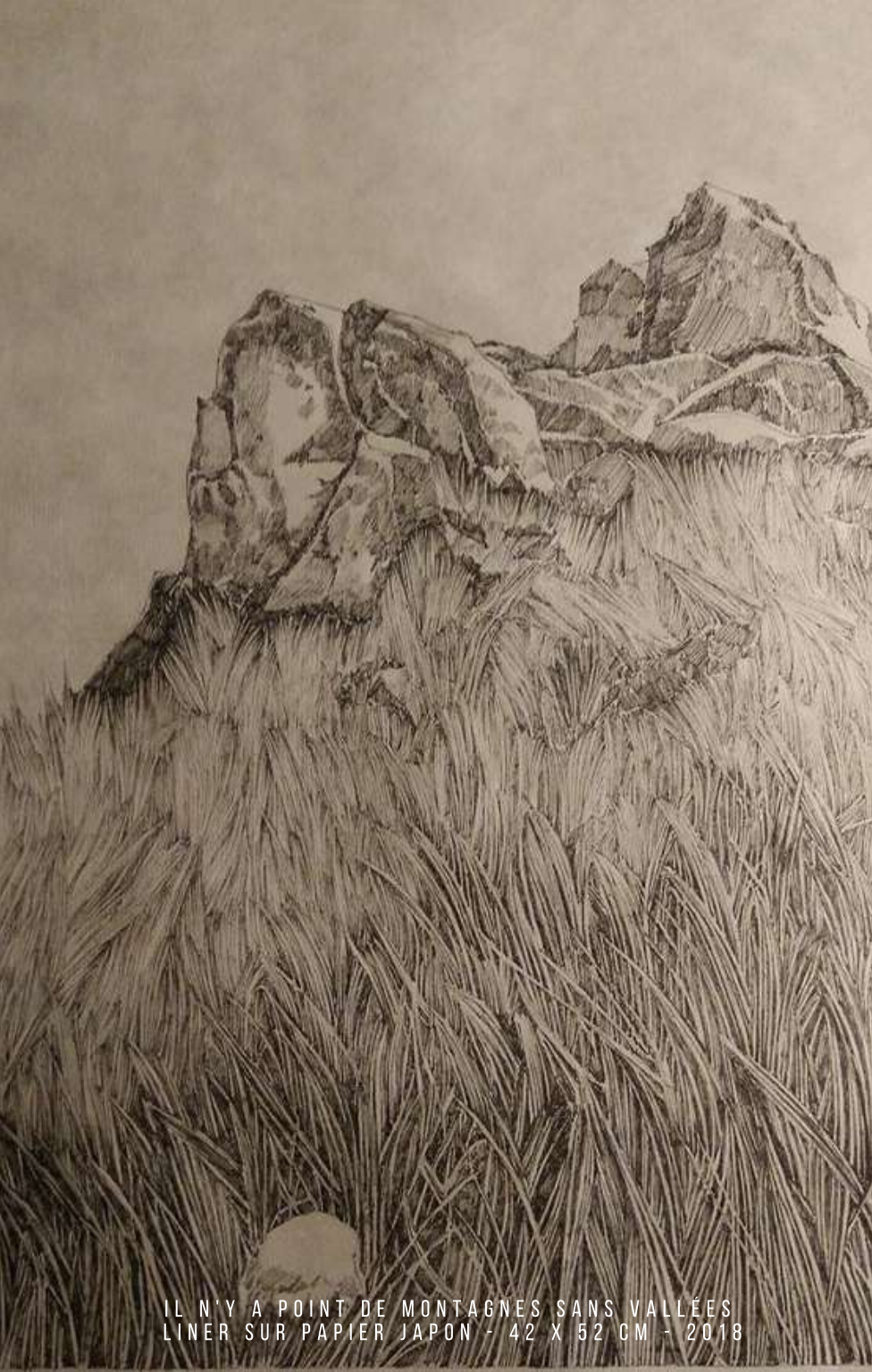
IL N'Y A POINT DE MONTAGNES SANS VALLÉES LINER SUR PAPIER JAPON - 42 X 52 CM - 2018