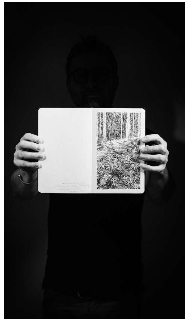
URWALD VON MORGEN - ENCRE DE CHINE SUR PAPIER MOLESKINE - 13 X 21 CM- ROTRING 0,1- 2019