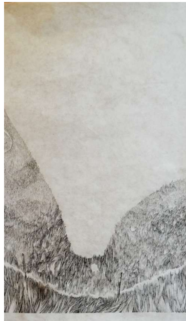
AND EVEN IF IT SNOW (3/3) - LINER SUR PAPIER JAPON - 65 X 100 CM, 2018