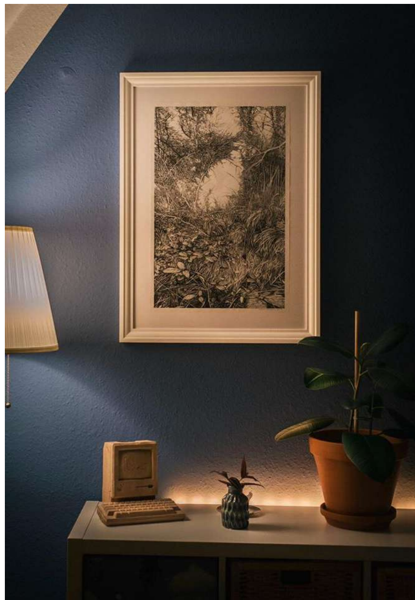
"WOOD" - ENCRE DE CHINE SUR PAPIER - 40 X 60 CM - 2019