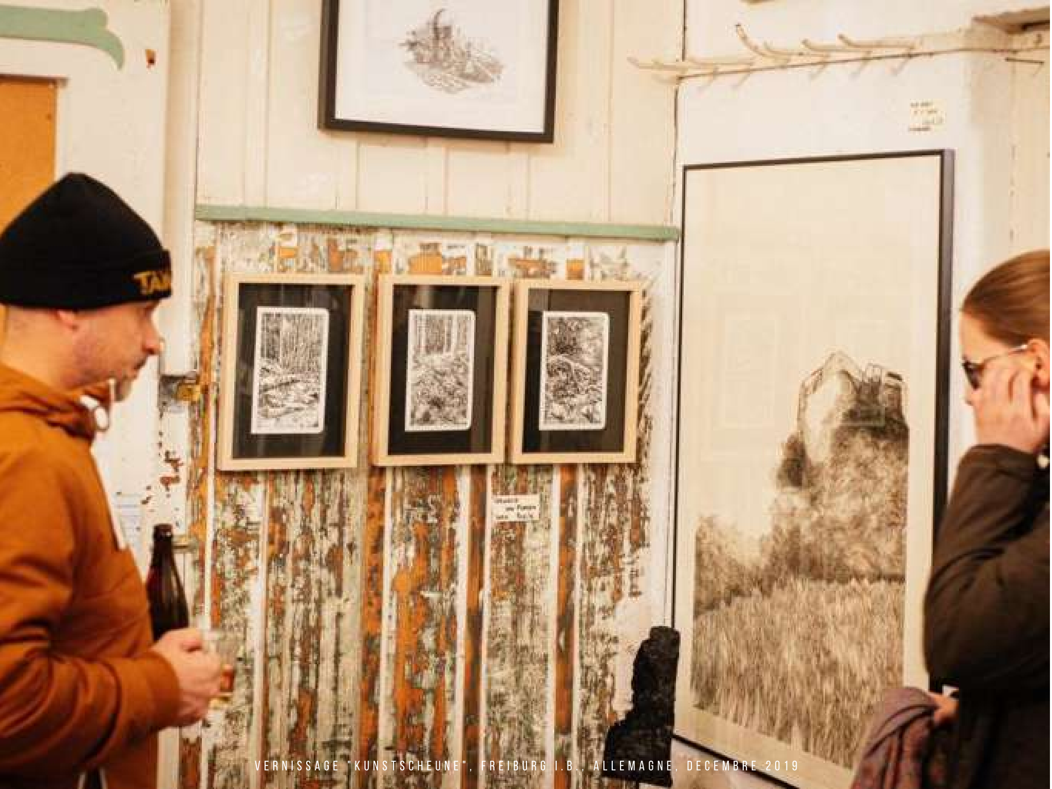
VERNISSAGE "KUNSTSCHAU", FREIBURG I.B., ALLEMAGNE, DECEMBRE 2019