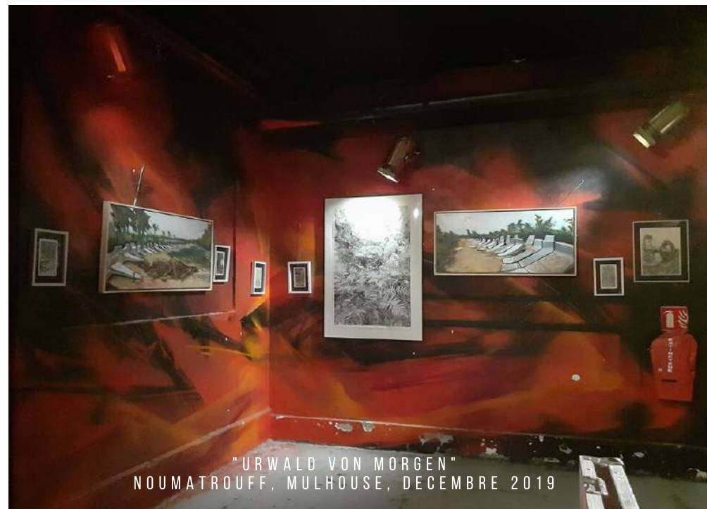
"URWALD VON MORGEN" NOUMATROUFF, MULHOUSE, DECEMBRE 2019