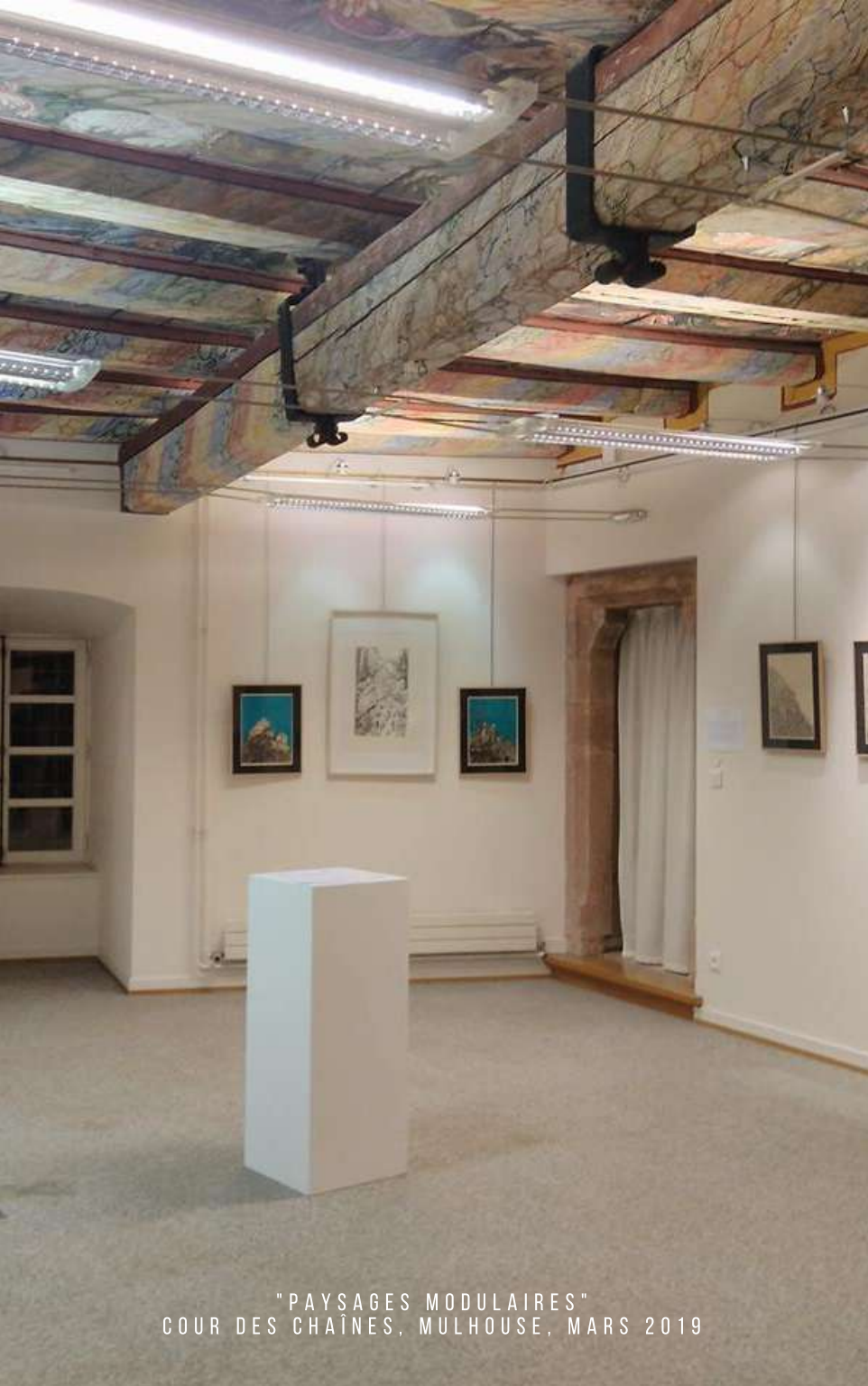
"PAYSAGES MODULAIRES" COUR DES CHAÎNES, MULHOUSE, MARS 2019