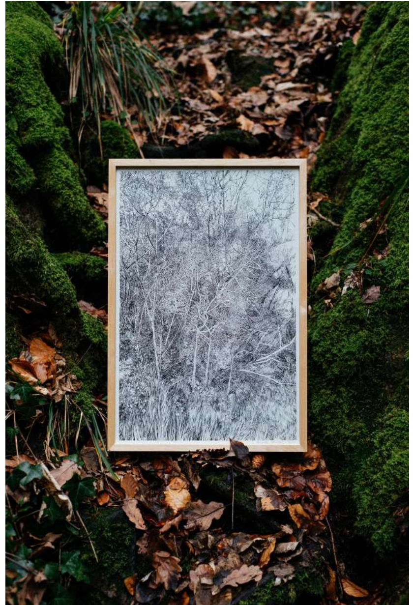
"SOMNAMBULISTIC FOREST" - ENCRE DE CHINE SUR PAPIER - 40 X 60 CM - 2020