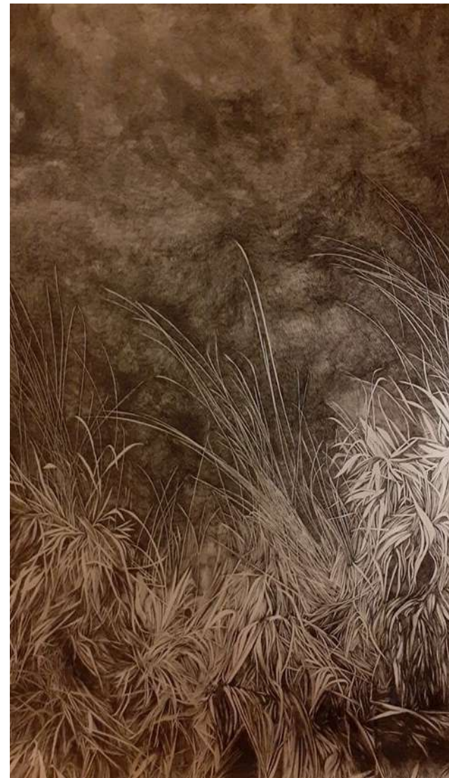
URWALD VON MORGEN- ENCRE DE CHINE SUR PAPIER - 120 X 80 CM ROTRING 0,2- 2019