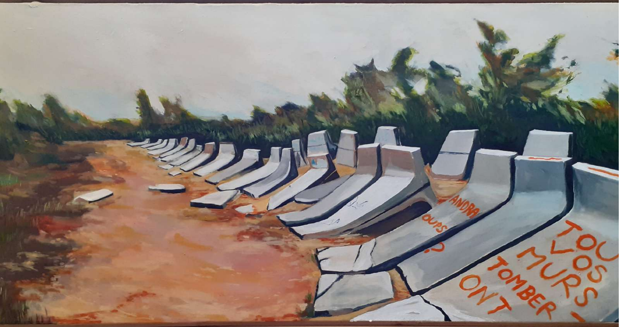
"BOIS LEJUC", MANDRES-EN-BARROIS, FRANCE DIPTYQUE, ACRYLIQUE SUR TOILE, 55 X 118 CM, 2019